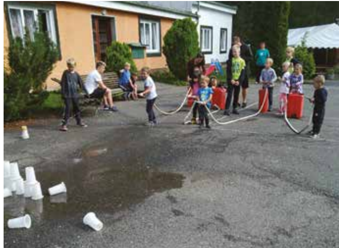
Soustředění Sv. Štěpán

Na konci srpna jsme na pár dní vyrazili na soustředění. Náš základní tábor jako vždy v rekreačním středisku Sv. Štěpán. Kromě tréninku jednotlivců a nácviku na blížící se oslavy založení sboru, bylo na programu plnění táborové hry na téma Záchrana Jurského světa. A tak jsme sbírali jantarové kamínky, hledali dinosaury a skládali mapu.