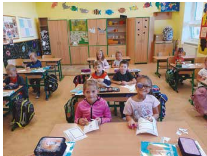
Prvňáčci při práci

Vedení školy také musí čelit současné inflaci a růstu cen energií – zdražují se školské služby, učebnice, pomůcky, vybavení, výukový software, ale nejhorší jsou ceny elektřiny, na kterých je závislý chod tepelných čerpadel a přístrojů ve školní jídelně. Rozhodně nejme příznivci uzavření nebo omezení provozu školy, dodnes se totiž vyrovnáváme s výpadkem řádné prezenční výuky v době covidu, zejména v sociální rovině. Zde by se měl na stranu škol razantně postavit stát a zajistit pokrytí provozních nákladů za dostupné ceny, které budou pod jeho kontrolou. Je však potřeba jednat rychle, než začne topná sezóna. Rozhodně nechceme, aby