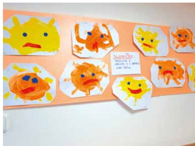
...a malovat sluníčko