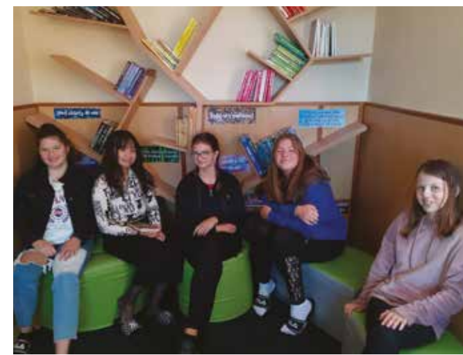
Děvčata z 9. třídy ve čtenářském koutku

„Pomáháme veřejným základním školám v tom, aby se všichni jejich žáci učili s chutí a nasazením a měli dobré výsledky. Za úspěch považujeme, když děti