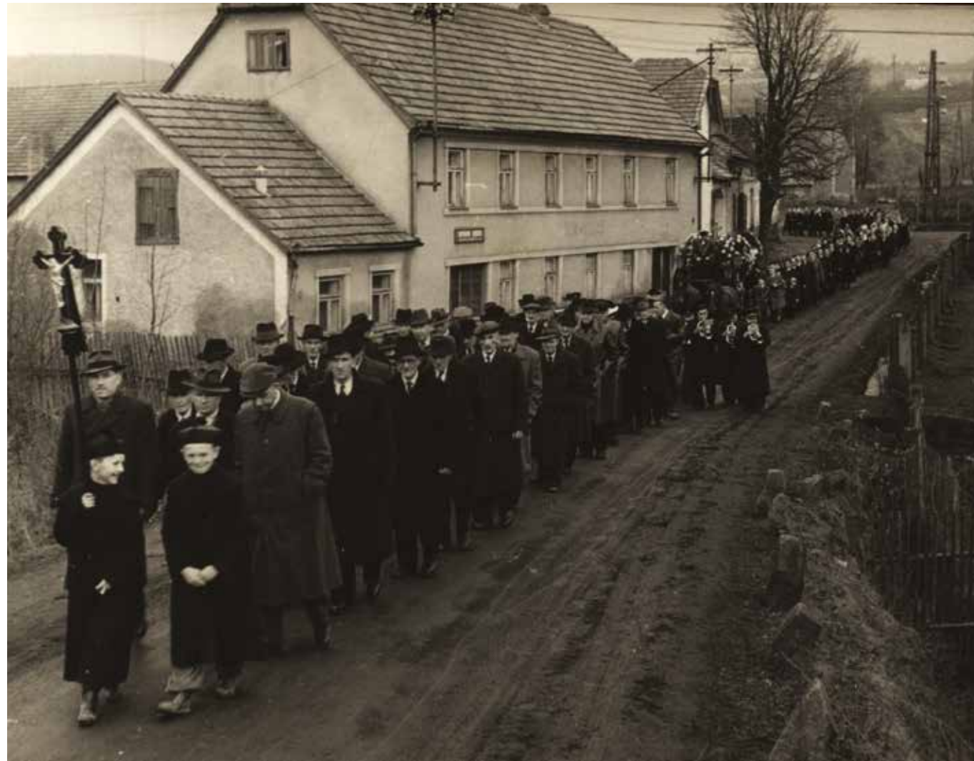
Hostinec u Klírů

V dnešním putování budeme pokračovat po dalších třech zaječovských hospodách.