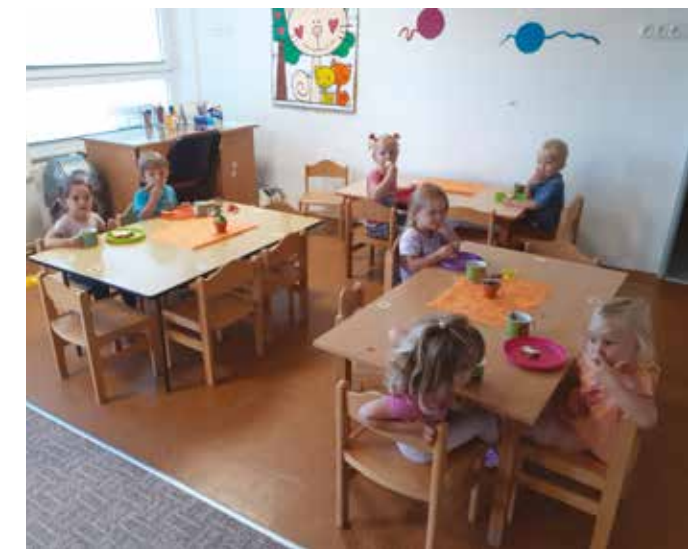
Nejmladší děti v MŠ, Koťata, při svačině

počasí pro pobyt přírodě, ti starší se dokonce už několikrát vydaly do lesa poznávat a sbírat hojně rostoucí houby.