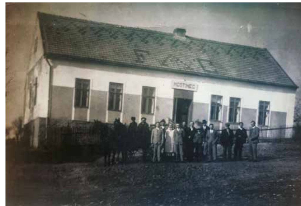
Kvaň č.p. 29 u Ciprů

Druhý tanec bývala žabička. To se na sále utvořil zástup, který se při různém rozpažování ubíral přes šenkovnu do kuchyně a zpátky na sál a přitom se překonávaly různé překážky, židle nebo stoly. Zajímavý byl taky ptačí tanec.