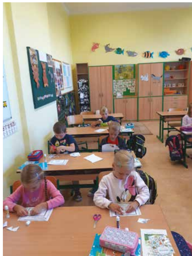
Prvňáčci při práci

Dále se budeme připravovat na změnu ŠVP od 1.9.2023, která bude spočívat v rozšíření a změně výuky informatiky. Již nyní vybíráme další vybavení, abychom mohli efektivně využít finanční prostředky ve výši 102 000,- Kč poskytnuté v rámci dotace na překonání „digitální propasti“. Následovat bude školení pedagogů a osvojení nových metod a forem práce.