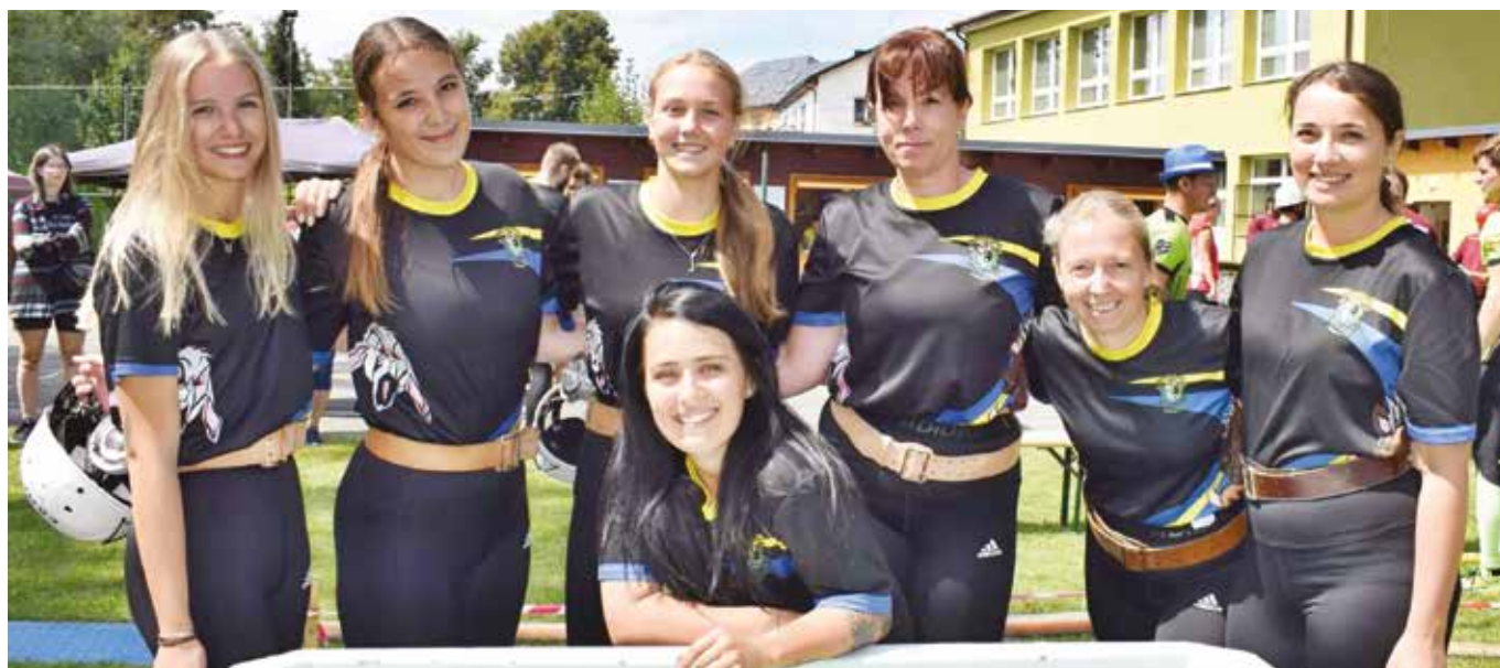
ženy BRDSKA LIGA Jesenice

Muži a ženy celé léto obírali jednotlivá kola Brdské ligy v požárním útoku. Na začátku panovalo velké nadšení z nadcházející sezóny, přece jen nová silnější