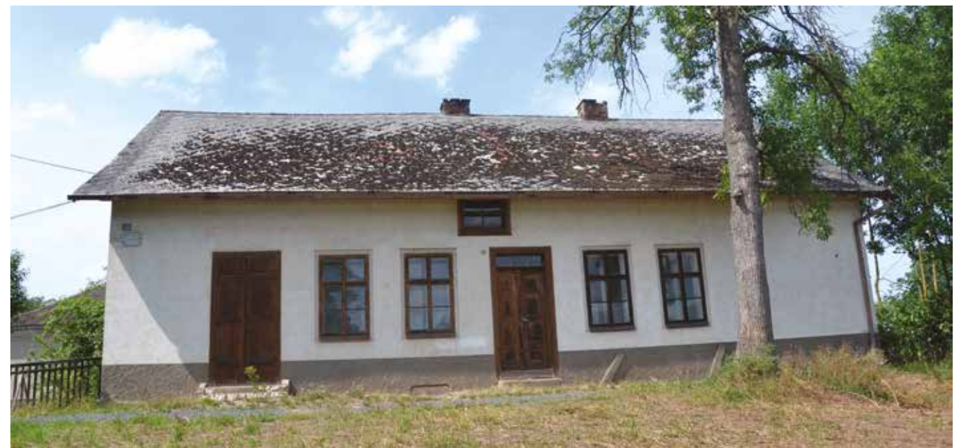
Hostinec na Hrázi (2019)