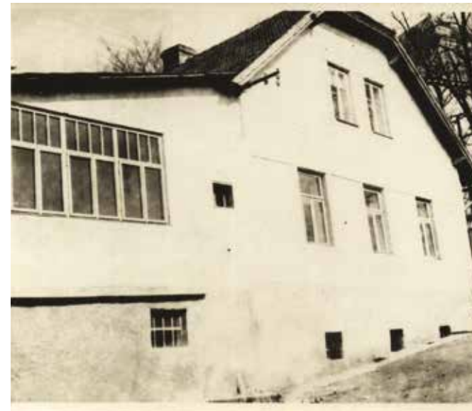
Hostinec u Blovků (Taušů)