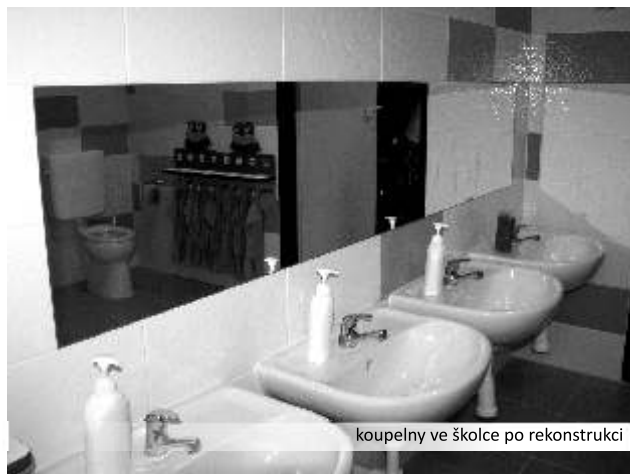
koupelny ve školce po rekonstrukci

Nezahálelo se ani v ostatních budovách. V červenci a srpnu probíhala rekonstrukce povodního sociálního zařízení dětí v ať a chlapců v pavilonu školy. Došlo ke kompletnímu odstranění starých dlažeb, nové instalaci vody, odpadů a instalaci nových dlažeb a obkladů. V prvním patře budovy byla obnovena výlevka a vodovod pro usnadnění úklidu budovy.