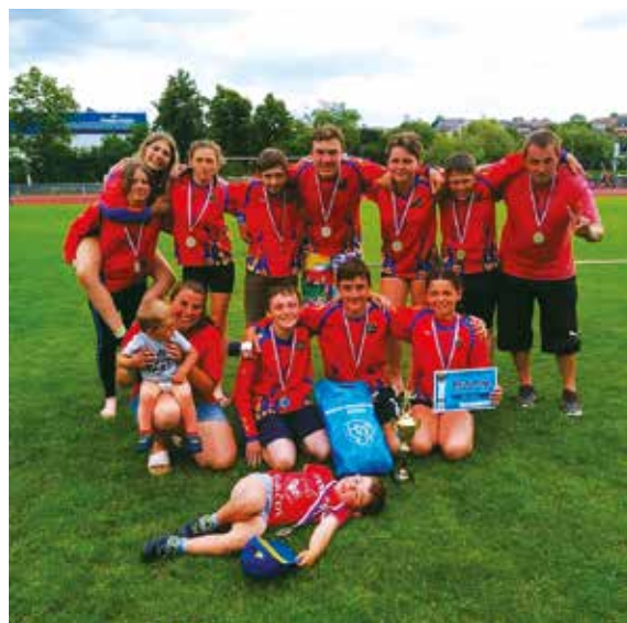
Starší žáci na krajském kole