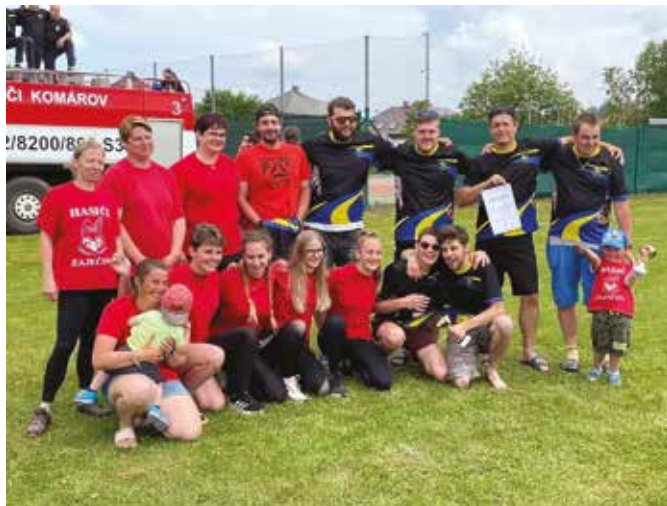
Družstvo mužů a družstvo žen

Po delší odmlce se nám opět povedlo složit družstvo žen. Muži tak nebudou v letošním roce objíždět soutěže sami. Obě družstva se vrhla do tréninků požárních útoků. Chodí se téměř pravidelně jednou týdně. Muži si přípravu zpestřili ještě soustředěním s SDH Skalice.