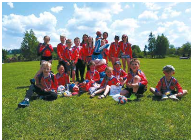
Mladší žáci a příprava

5.6. probíhala okresní soutěž také pro kategorie přípravky a mladších žáků. Nejkrásnější kategorie pří-