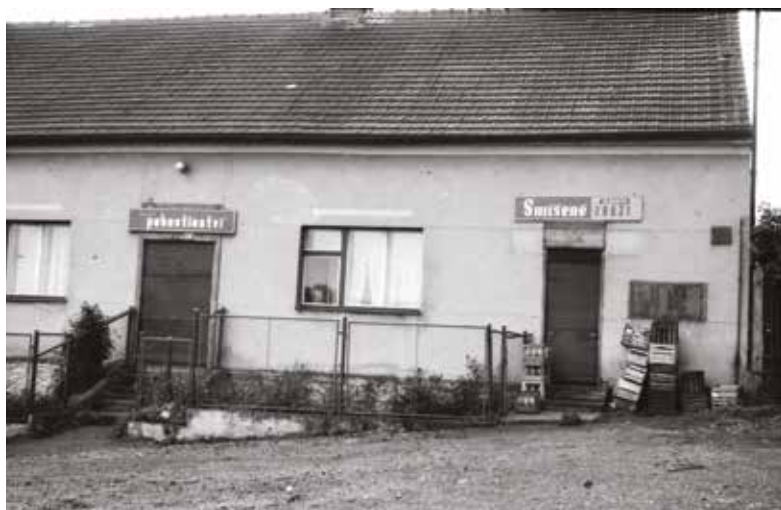
Smíšené zboží a pohostinství na Kvani u Ciprů

Prodejny koloniálu, smíšeného zboží, později Jednoty sloužily občanům především u Kláštera, v Horním Zaječově, v Koutě, v Kozojedech a v Horní Kvani. Dnes se podíváme na prodejny na Kvani.