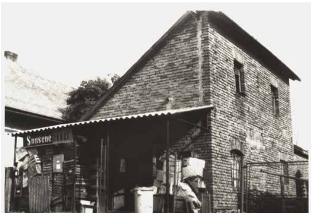
Prodejna v Kozojedech u Jaroše