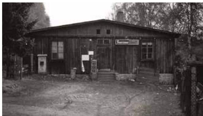
Arma v Koutě