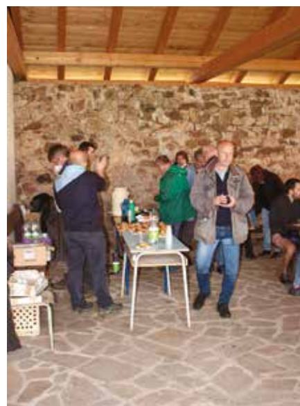
Chvilka odpočinku a občerstvení