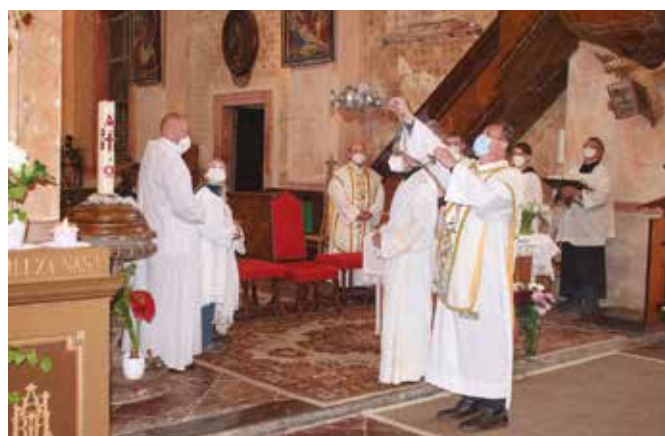
Slavnostní poutní mše