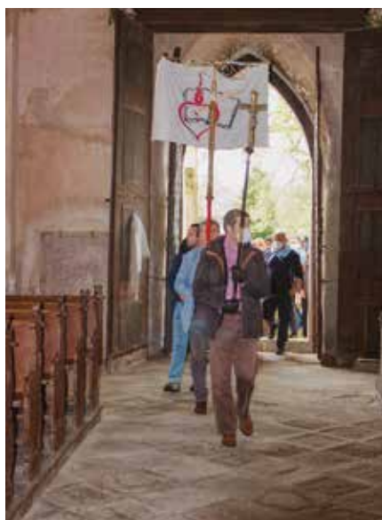
Příchod poutníka do chrámu

Mše byla nádherná a předznamenala (snad) návrat k normálnímu životu bez omezujících opatření. Přejme si, aby příští XXV. Mariánská pouť byla stejně krásná a pohodová.