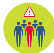
Vyhýbejte se zjevně nemocným a místům s vyšším počtem lidí