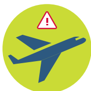
Necestujte do zasažených oblastí