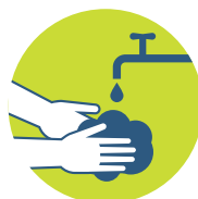
Často a důkladně si myjte ruce mýdlem a vodou